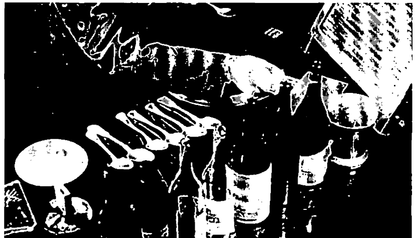
L'Homme à la caméra de Dziga Vertov